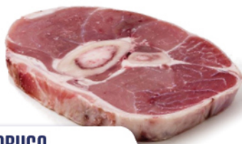
OSSOBUCO DI VITELLO