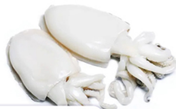
SEPPIE MAROCCO 2000/UP