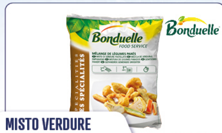
MISTO VERDURE PASTELLATE