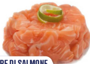
TARTARE DI SALMONE