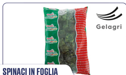
SPINACI IN FOGLIA A PORZIONI