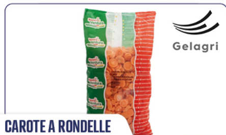
CAROTE A RONDELLE LISCE