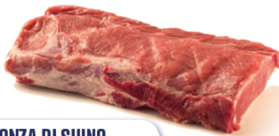
LONZA DI SUINO 1/2