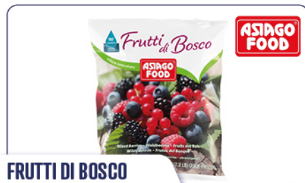
FRUTTI DI BOSCO 4 GUSTI