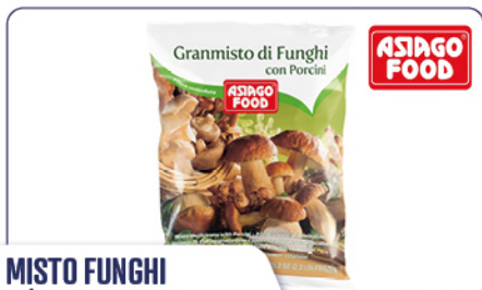
MISTO FUNGHI C/PORCINO 10%