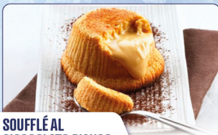
SOUFFLÉ AL CIOCCOLATO BIANCO