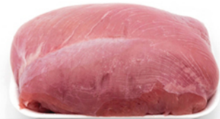
FESA DI TACCHINO 1/2