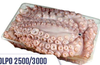
POLPO 2500/3000 VASCHETTA