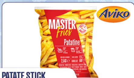
PATATE STICK MASTERFRIES