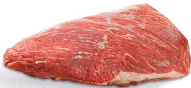
SPINACINO DI FASSONA PIEMONTESE