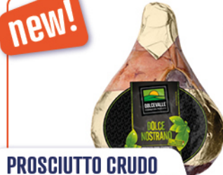
PROSCIUTTO CRUDO NOSTRANO 12/13 MESI S/O