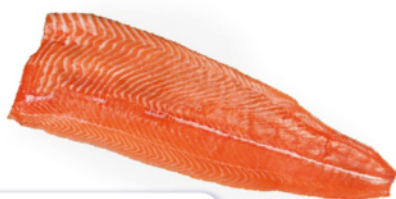
FILETTO DI SALMONE NORVEGIA TRIM. D S/V