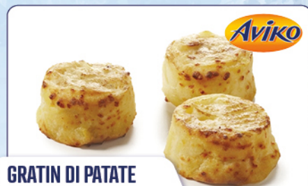
GRATIN DI PATATE E FORMAGGIO