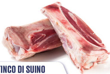
STINCO DI SUINO 1/2