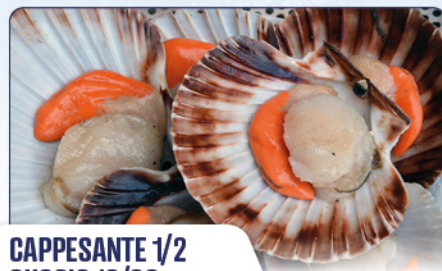
CAPPESANTE 1/2 GUSCIO 10/20