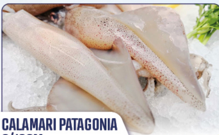
CALAMARI PATAGONIA 9/10CM