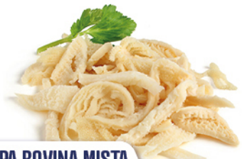
TRIPPA BOVINA MISTA COTTA E AFFETTATA