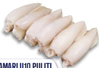
CALAMARI U10 PULITI THAI BLOCCO