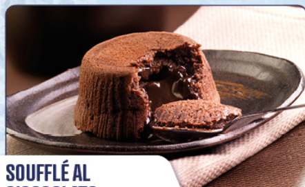
SOUFFLÉ AL CIOCCOLATO