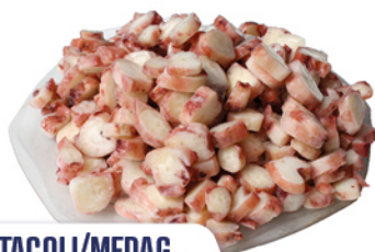
TENTACOLI/MEDAG. GIGAS COTTO-TAGLIATI