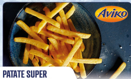
PATATE SUPER CRUNCH AMIDO