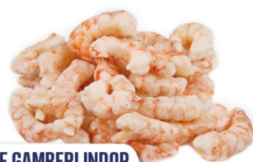
CODE GAMBERI INDOP. COTTO-SGUSC. 80/120