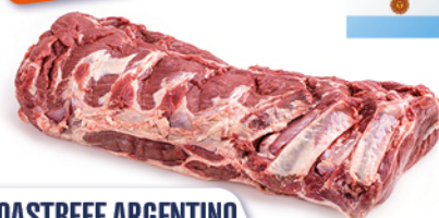
ROASTBEEF ARGENTINO GRASS FED