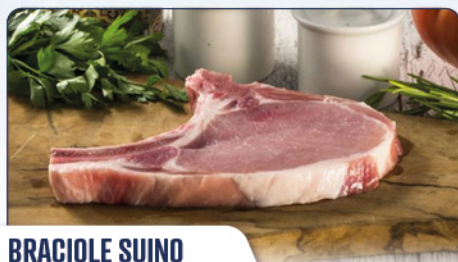
BRACIOLE SUINO 150/170G IQF