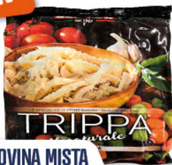
TRIPPA BOVINA MISTA COTTA E AFFETTATA