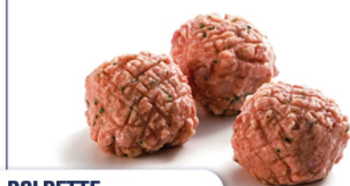
POLPETTE DI BOVINO