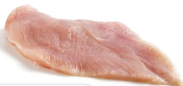
PETTO DI POLLO A FETTE IQF