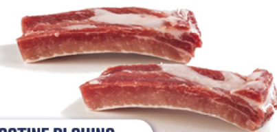
COSTINE DI SUINO TAGLIATE 100/120g