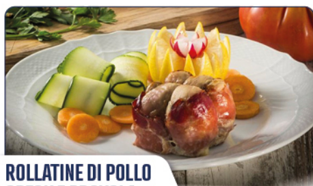
ROLLATINE DI POLLO SPECK E PROVOLA