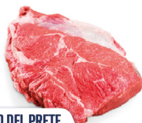
CAPPELLO DEL PRETE COPERTINA FASSONA